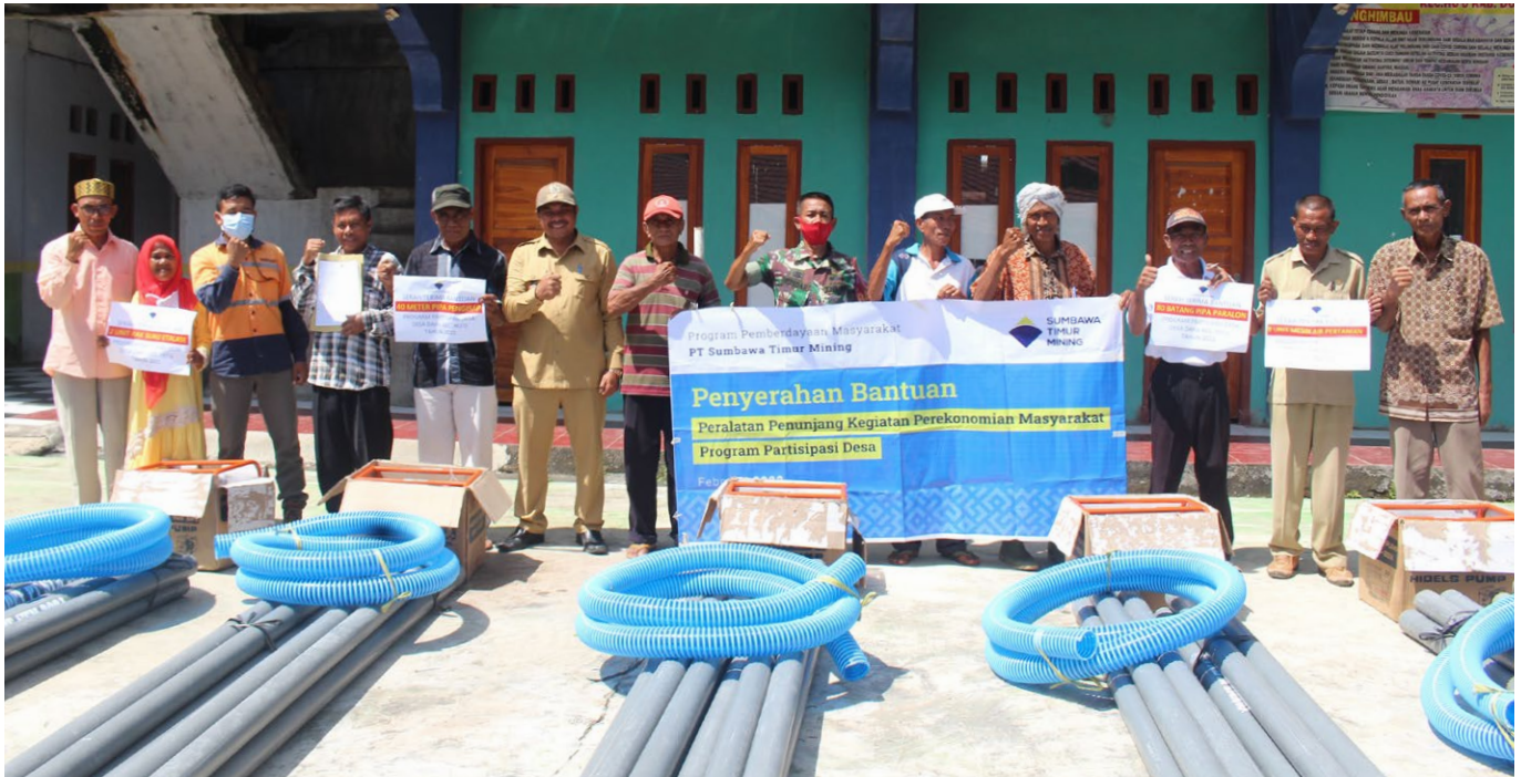
Penyerahan bantuan mesin kepada kelompok tani di Desa Daha

PT Sumbawa Timur Mining (PT STM) menyerahkan bantuan mesin penyedot air permukaan untuk irigasi pertanian bagi petani di Desa Daha, Kecamatan Hu'u. Bantuan yang diterima langsung oleh delapan kelompok tani di Desa Daha ini merupakan bagian dari Program Pemberdayaan Masyarakat PT STM melalui Program Partisipasi Desa.